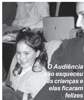
O Audiência não esqueceu as crianças e elas ficaram felizes

aprender a representar. "Na política há uma dose de representação que nós temos de manter sempre actualizado." Quanto ao espectáculo "muito bom!".